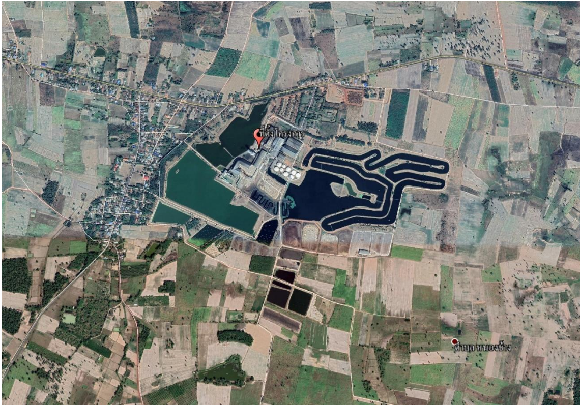
รูปที่ 1.2-1 ที่ตั้งโครงการ